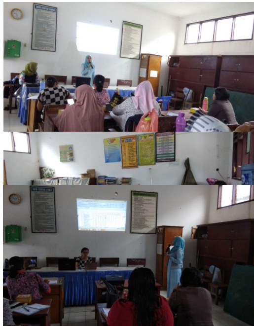
Gambar 1. Tim Pelaksana Melaksanakan Sosialisasi