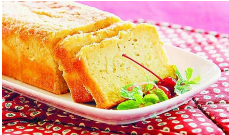
Gambar 1.1 Hasil Olahan Produksi Olahan Kue Dari Hasil Pertanian (Perkebunan)

Ekonomi kreatif adalah Wujud dari upaya pembangunan yang berkelanjutan melalui kreativitas, yang mana pembangunan yang berkelanjutan adalah suatu iklim perekonomian yang berdaya saing dan memiliki cadangan sumber daya yang terbarukan, (2017:01).