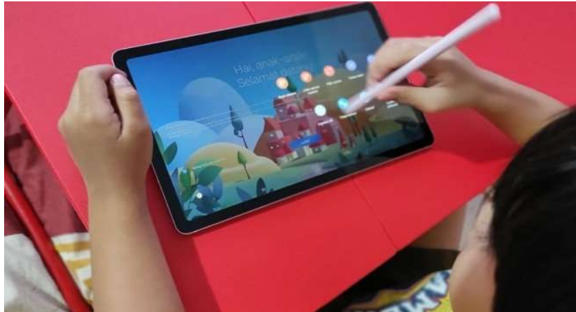
Gambar 1.3 Proses Daring (Belajar Dari Rumah) Atau Jarak Jauh Berbasis Digital